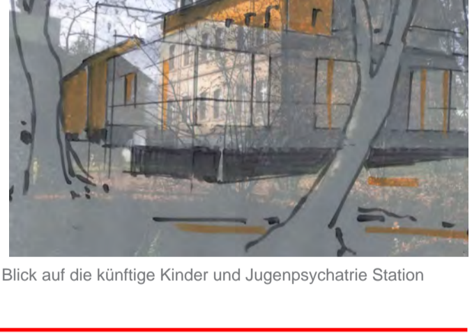
Blick auf die künftige Kinder und Jugendpsychiatrie Station