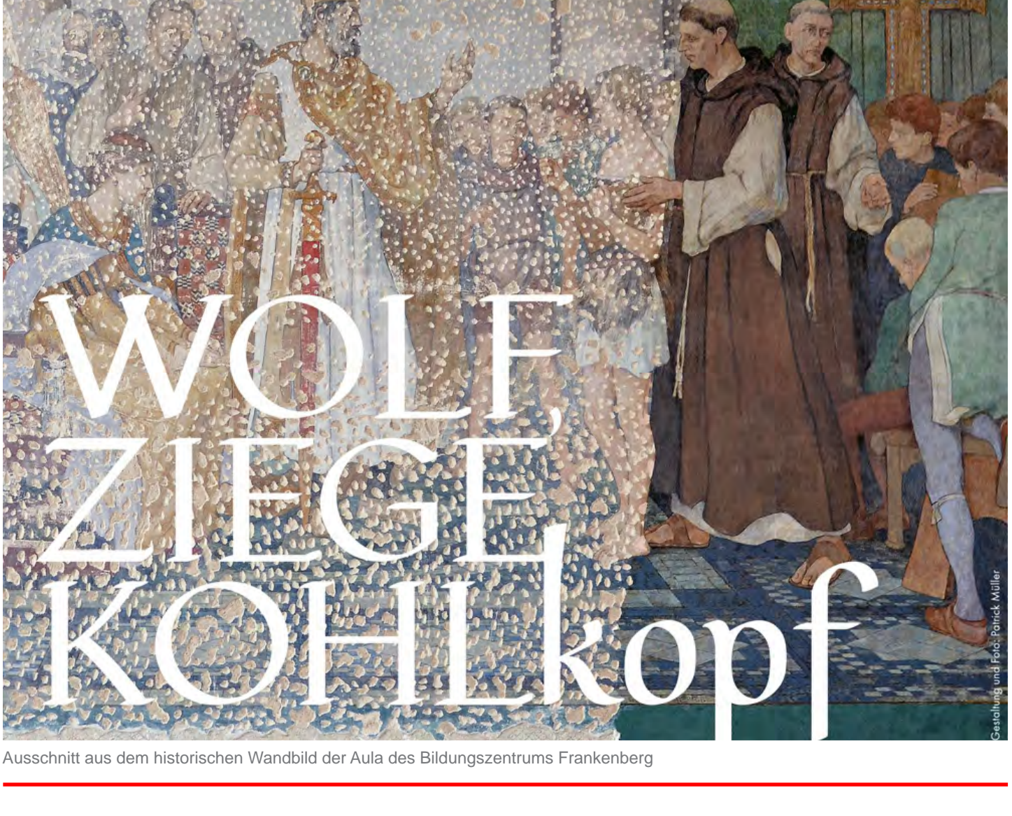
Ausschnitt aus dem historischen Wandbild der Aula des Bildungszentrums Frankenberg