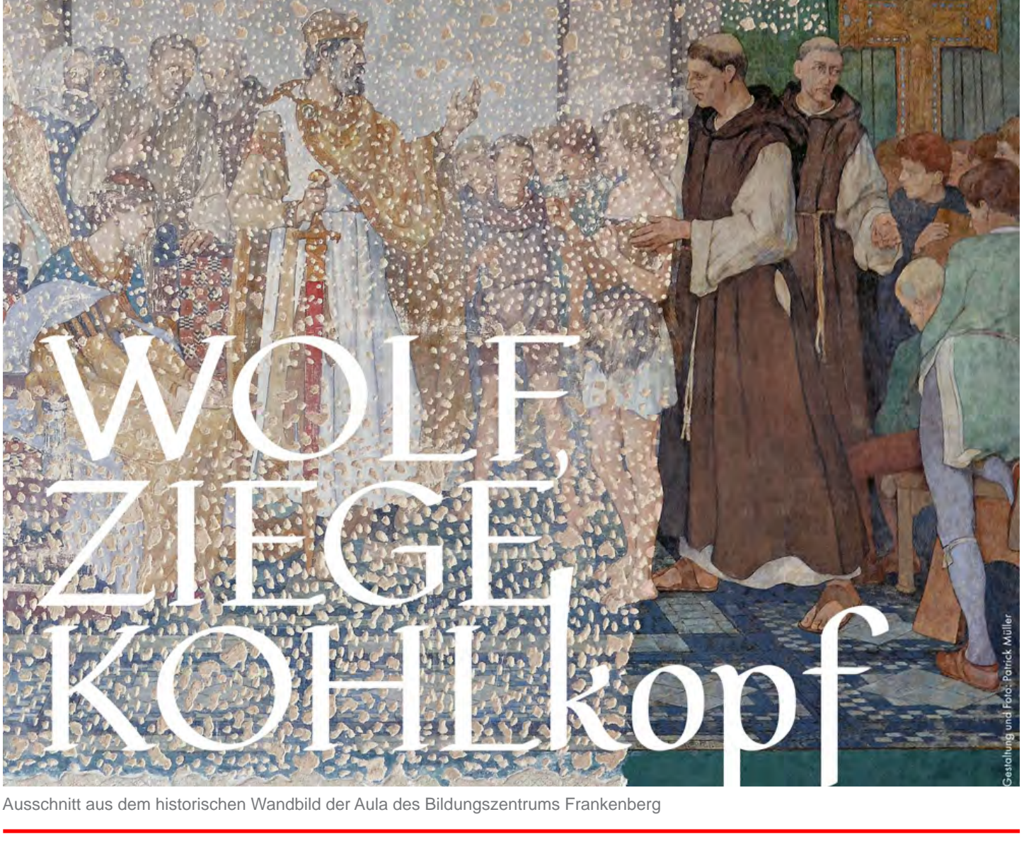
Ausschnitt aus dem historischen Wandbild der Aula des Bildungszentrums Frankenberg