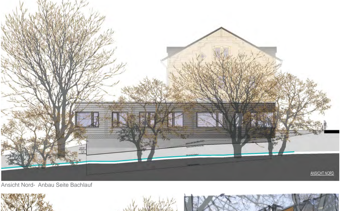
Ansicht Nord- Anbau Seite Bachlauf

Seit einiger Zeit bewegen wir uns auf bisher unbekanntem Terrain, dem des Sächsischen Krankenhauses für Psychiatrie und Neurologie Rodewisch. Geschuldet ist dies nicht dem täglichen Trubel, sondern dem Auftrag zur Sanierung und Erweiterung des Gebäudes B14 zur Institutsambulanz. Das Gebäude ist Bestandteil des im typischen Baustil des Historismus als villenartige Einzelhausbebauung in einer parkähnlichen Grünanlage Ende des 19. Jahrhunderts errichteten denkmalgeschützten Krankenhausensembles. Um die geplante Nutzung durch drei Stationen unterzubringen, ist neben der Sanierung des Altbaus auch ein Anbau geplant. Die Entwurfsidee für den Erweiterungsbau lässt sich zusammenfassen als zurückhaltender Riegel, der durch den zurückgesetzten Sockel hinter der Kulisse der Bäume des bestehenden kleinen Bachlaufs schwebt. Die dunkle Keramikfassade nimmt die Materialität des Altbaus auf, überlässt durch seine Farbigkeit aber dennoch dem Altbau die optische Domianz.