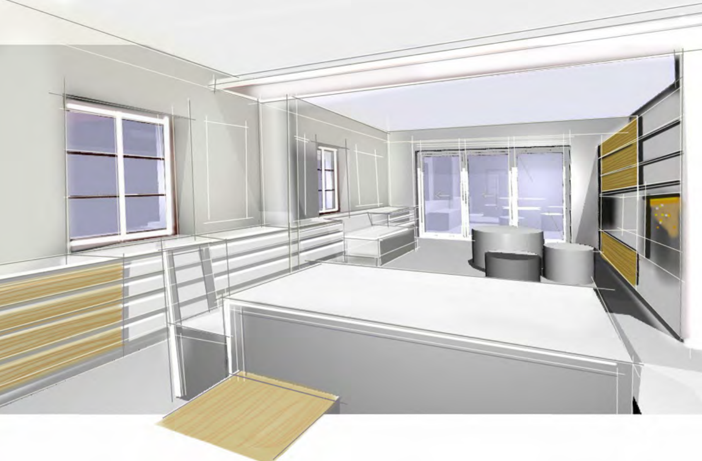
Entwurfsskizze Wohnraum, Farbkonzept Woodline