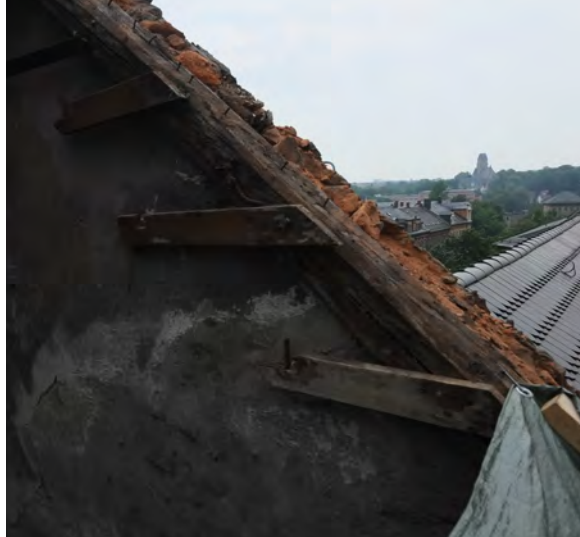
Blick vom künftigen Balkon Richtung Schlosskirche