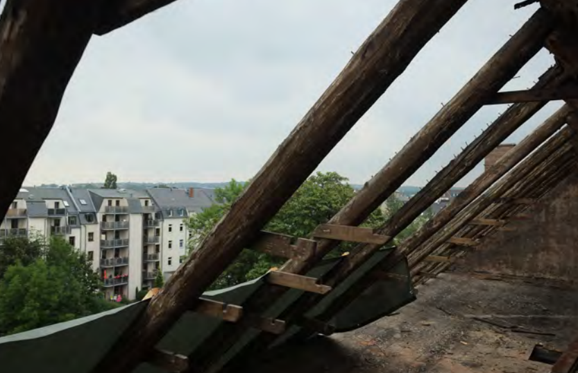
Blick von der künftigen Dachterrasse Richtung Innenstadt