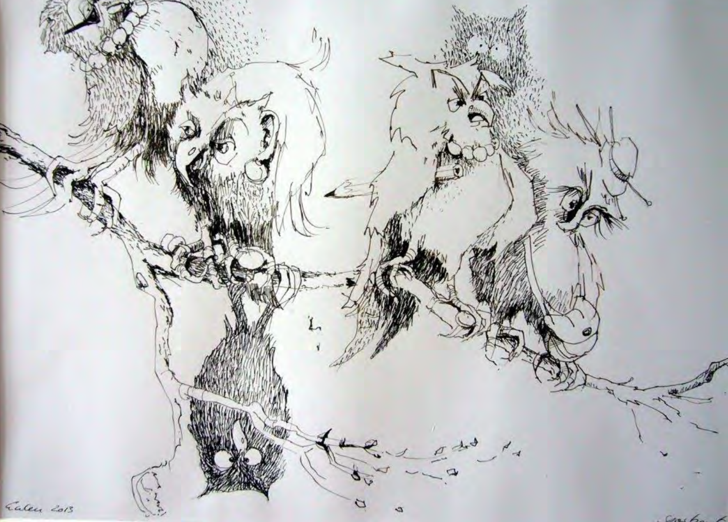
O. Sporbert „Eulen“, Federzeichnung 2013

Zusammenfassung „Der 5- und 6. Tag - Das Tier im Spiegel der Kunst“, 11. bis Ende Juli, St. Aegidien Kirche Frankenberg