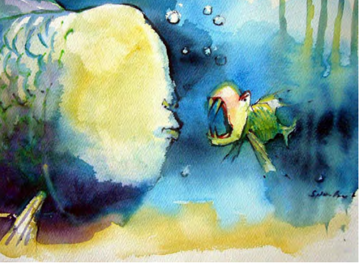
O. Sporbert „Kleiner Fisch ganz groß“, Aquarell, 2012