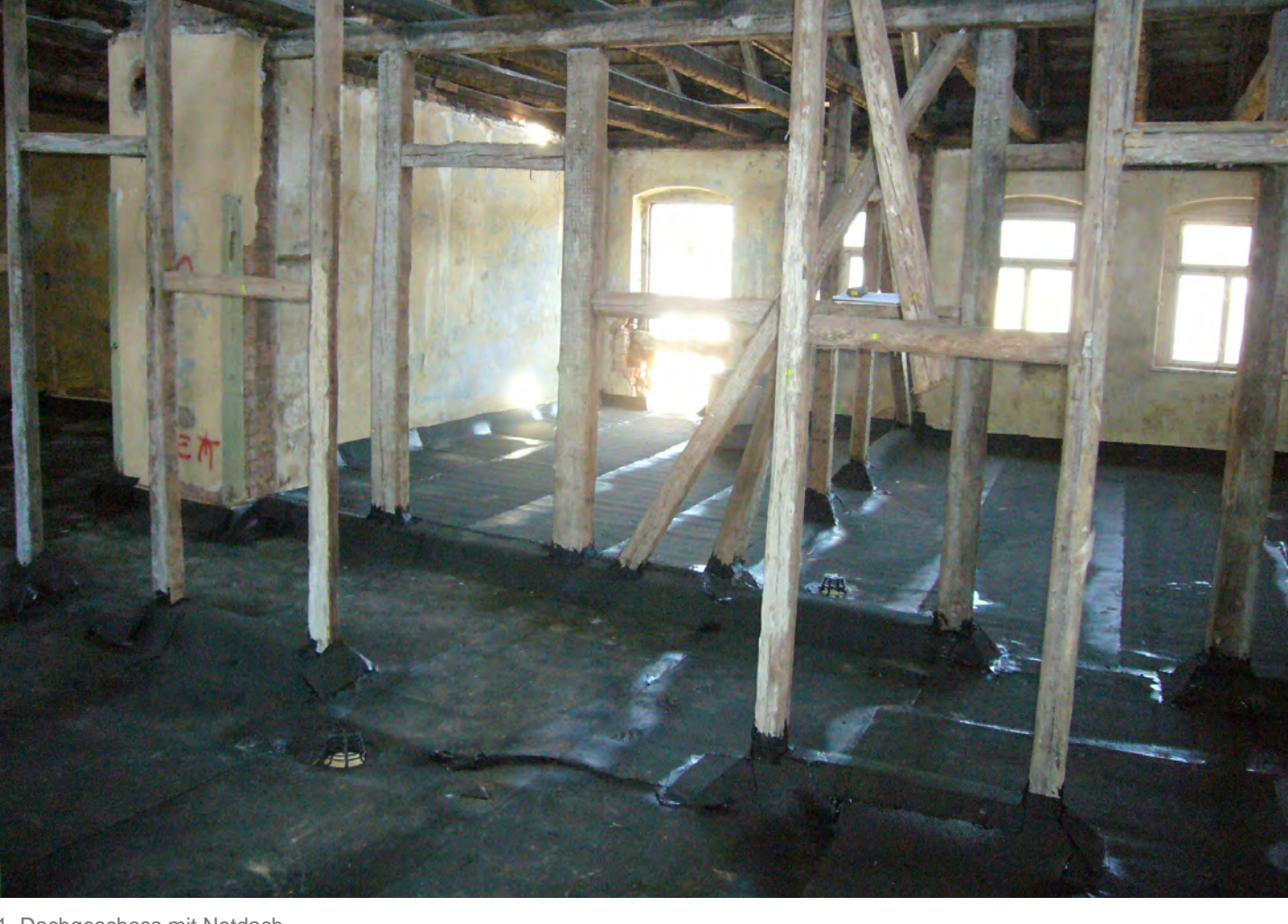
1. Dachgeschoss mit Notdach

Die von uns betreute Sanierung eines Mehrfamilienhauses am Brühl steht seit Baubeginn im Juni unter dem Thema Abdichtung. Nachdem in den vergangenen Wochen vor allem im Keller gearbeitet wurde, ist nun das Dach an der Reihe. Auch hier spielt das Thema eine große Rolle. In Anbetracht des unbeständigen Sommers wurde auf der obersten Geschossdecke eine wannenartige Abdichtung als Notdach hergestellt bevor im Folgenden der marode Dachstuhl abgebrochen und ein neuer wieder aufgebaut wird. Bei den heftigen Regengüssen hat sich diese Maßnahme bereits bewährt.