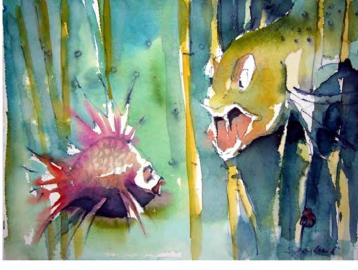
O. Sporbert „Stachelige Angelegenheit“, Aquarell, 2012