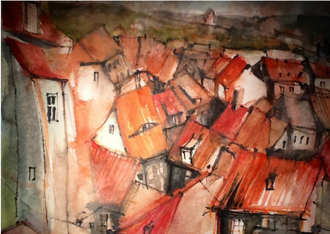
Über Meißen - Aquarell Olaf Sporbert 2012

Auch außerhalb der Veranstaltung können Sie die Galerie Triebe, Raumdesign , Rudolf- Breitscheid- Straße 2a, 09577 Lichtenwalde direkt gegenüber der Schloßmauer nach mögl. vorheriger tel. Abstimmung unter Telefon 037206 / 81222 besuchen